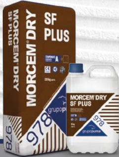
MORCEM DRY SF