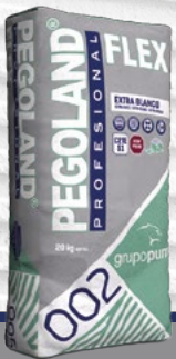
PEGOLAND PROFESIONAL FLEX

PROMOCIÓN PROMOCIÓN PROMOCIÓN POR LA COMPRA DE ESTOS 3 PRODUCTOS