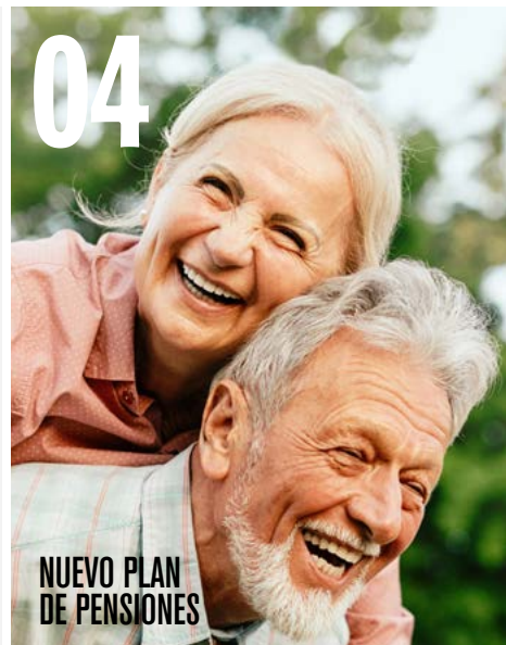
04 NUEVO PLAN DE PENSIONES