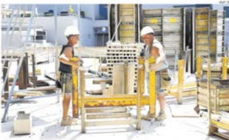
Cometas trabajando durante la mañana en una obra en Castellón. A la izquierda: poco de temperatura de los días.