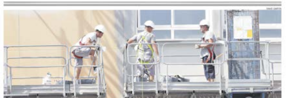
El sector provincial de la construcción defende que también es necesario activar el alijo público en Castellón para impulsar promociones de vivienda de promoción pública.

LA PROVINCIA QUEDA FUERA DE LA PROMOCIÓN DE MIL VIVIENDAS IMPULSADA EN ALICANTE Y VALENCIA