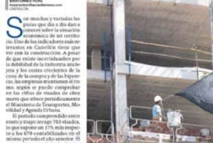
La construcción de viviendas se mantiene en los principales núcleos a pesar de las dudas sobre la economía.

Puntos con una alta demanda, como Benicàssim o Castelló, cuentan con nuevas promociones