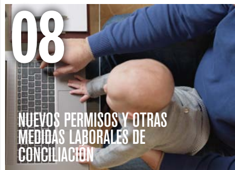
08 NUEVOS PERMISOS Y OTRAS MEDIDAS LABORALES DE CONCILIACIÓN