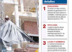
Los primeros meses del año han sido buenos para la construcción de viviendas de promoción pública en Castellón.

«Los proyectos de viviendas de promoción pública... Con la actualización del plan... Los sindicatos ven las empresas «más concionadas» tras la ley de estrés térmico...»