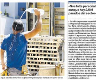
Aja, bridas con rosca o gresos anegados para retirar con parte de Aja.