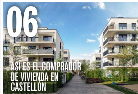
06 ASÍ ES EL COMPRADOR DE VIVIENDA EN CASTELLÓN